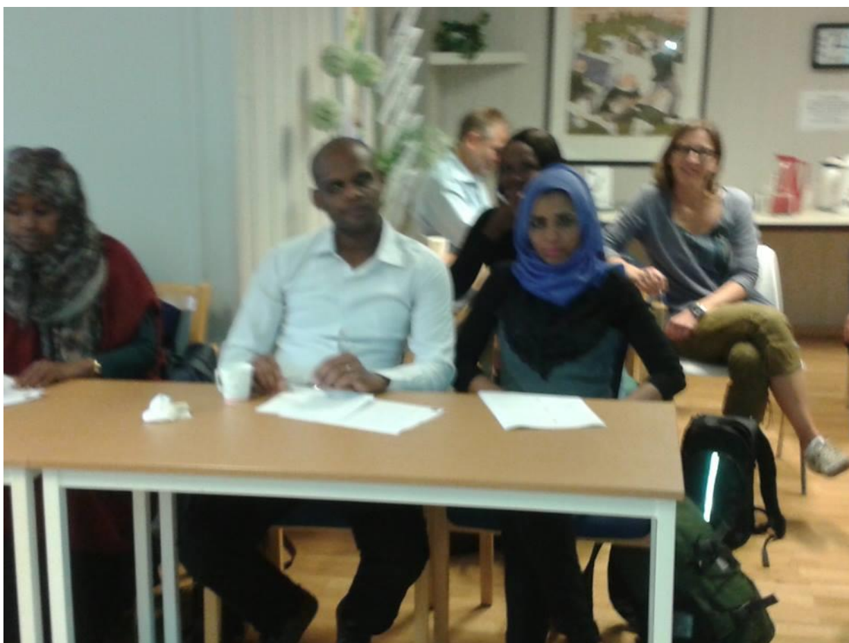
Bilde: Informasjonsmøte for Flerkulturelle og for programrådgivere NAV på EVA høsten 2016.

EVA sitt oppdrag var å kartlegge muligheter for og eventuelt å kvalifisere innvandrere i kvalifiseringsprogrammet til å kunne utvikle og eventuelt etablere egen virksomhet.