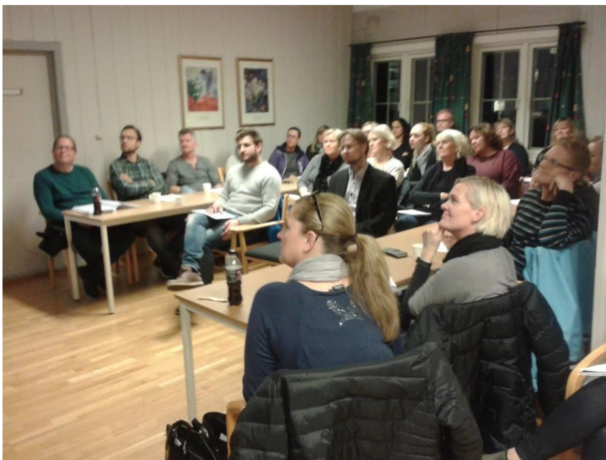
Bilde: EVA-kurs i «digital markedsføring».

Utover det faste kurstilbudet, arrangerer EVA, jevnlig kurs for medlemmer i organisasjoner som SØRF, for elever på Tangen vgs. og på KKG, for kommunal voksenopplæring og for ansatte i bedrifter som er i omfattende nedbemanningsprosesser, som f.eks. NOV og MH Wirth, og for diverse interesseorganisasjoner, fagforbund m.v..