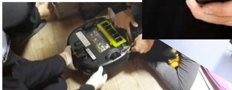
Kvinnen skal ha mistet rundt 8 hårlokker i møtet med robotstøvsugeren.