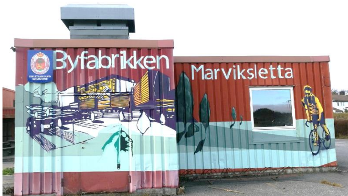
Byfabrikken på Lund

Byfabrikken er en arena for innbyggerdialog og medvirkning hvor man kan kommunisere og diskutere den transformasjonen som vil skje i Marviksletta de kommende årene. Bygget kan brukes av utviklere og aktører i nærmiljøet og velforeninger for informasjon- og dialogmøter, forhandlinger med grunneiere og andre som kan bli berørt av de utbyggingsplanene som foregår i området. Byfabrikken er et treffpunkt, et sted for ideutvikling og møter. For mer informasjon om Byfabrikken, klikk her .