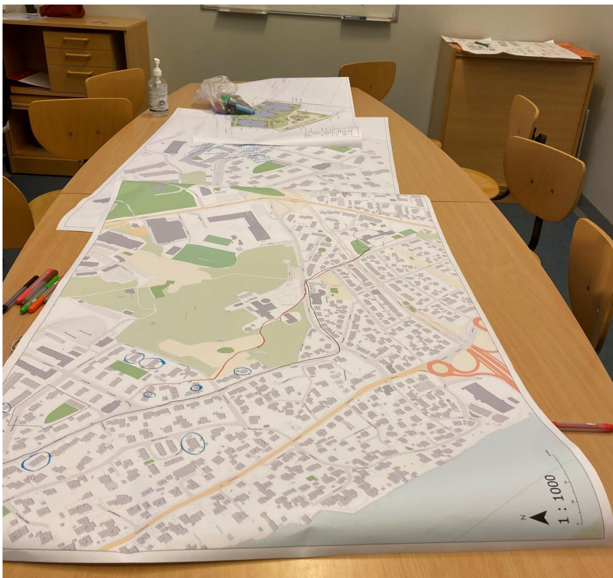
Figur 1. Kartene som ble brukt i møtet med elevene.

Forslagsstiller v/Espen Solheim (Gimlevang Boligutvikling) og Anne Lislevand (Asplan Viak) gjennomførte møtet.