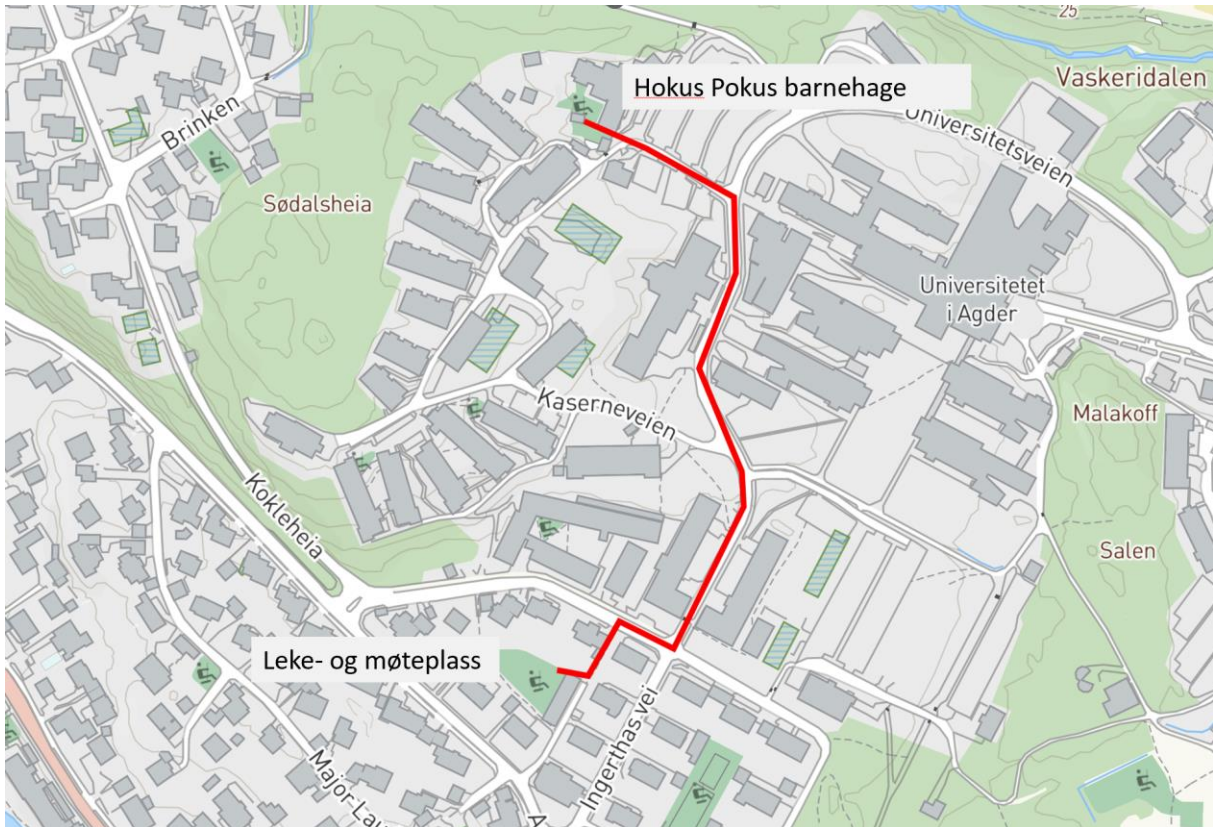
Figur 4. Kartutsnitt som viser veien fra Hokus Pkus barnehage til planområdet og leke- og møteplassen. Avstanden er ca. 500 m.