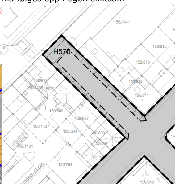
Utsnitt av plankart; Holbergs gate mellom Kristian IVs gate og Tordenskjolds gate.