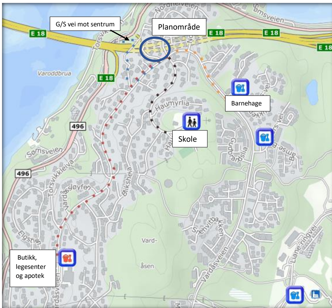
Fig 1 viser forbindelser til viktige forbindelser i gang og sykkelavstand

Blå stiplet linje viser forbindelsen til G/S vei til Kristiansand sentrum