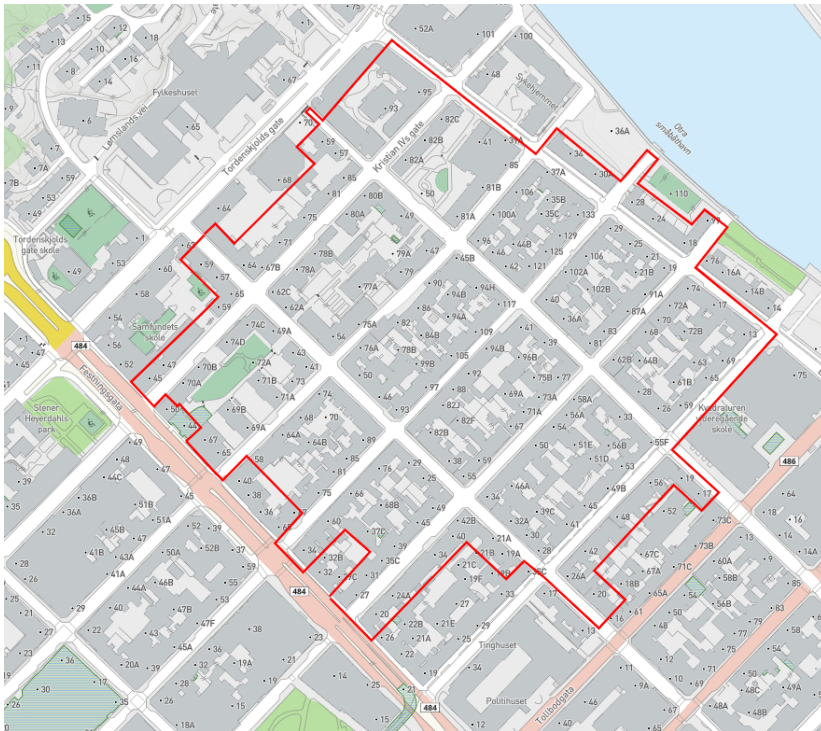
Forslag til ny avgrensing av sonen

I 2023 er det gitt ut 293 boligsonekort i sone 1.