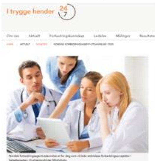
Nordisk forbedringsagent-utdannelse i 2020

Nordisk forbedringsagent (Hdir): Opplegg over 9 mnd 3 samlinger (7 dager) 6 websamlinger (1,5t)