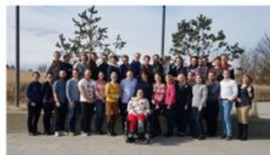
Deltakere på forbedringsutdanning i Helse Vest.

Populær forbedringsutdanning i Helse Vest