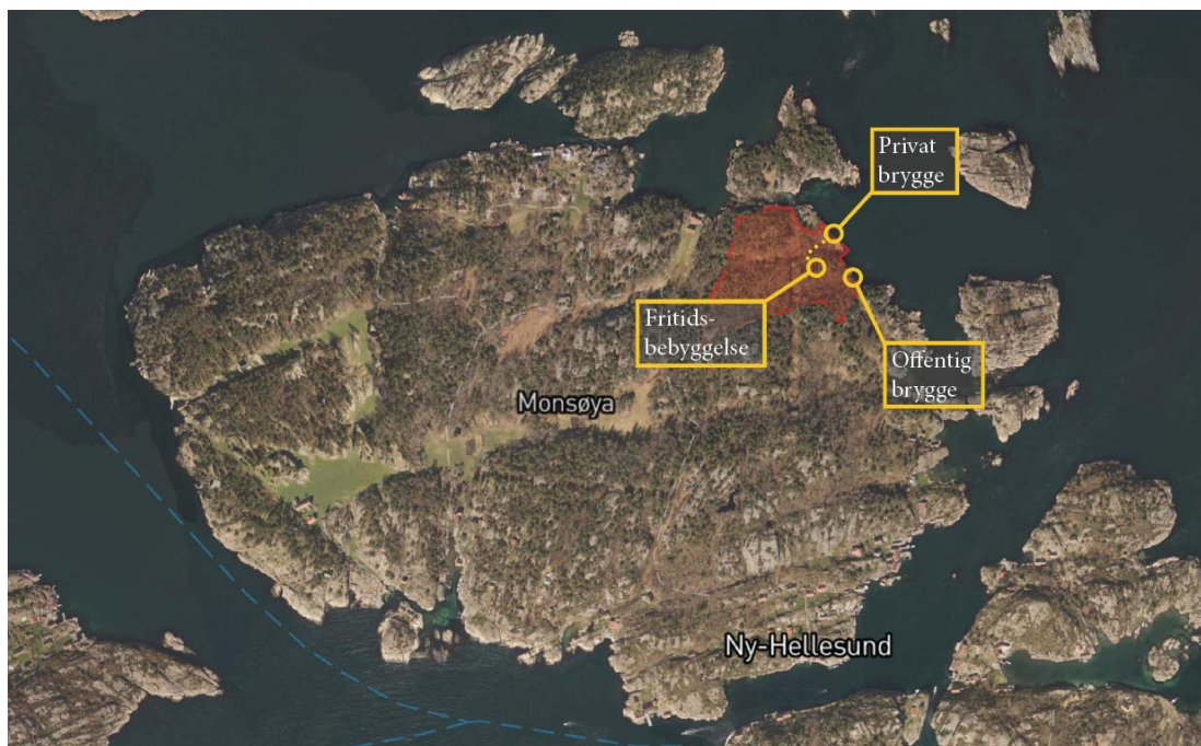
Figur 1 - Tiltaket befinner seg på nord-vest på Monsøya i Ny-Hellesund