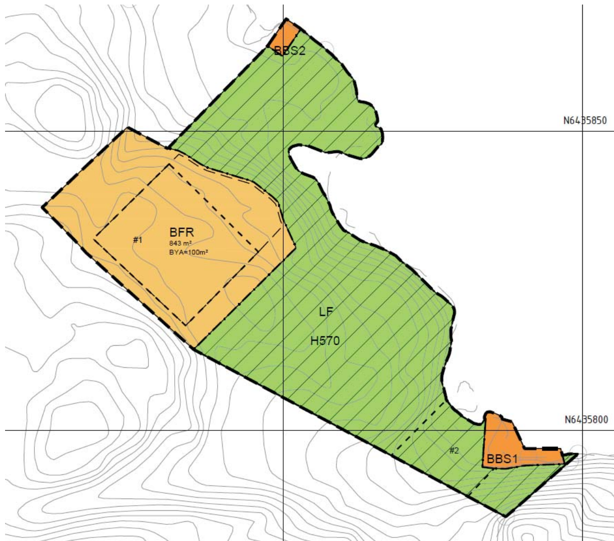
Figure 1 - Utklipp av forslag til plankart hvor BFR viser byggegrenser for hytte og opparbeidet uteareal, #1 viser plassering av bebyggelse, BBS2 privat brygge, BBS1 offentlig tilgjengelig brygge, #2 viser området servituttavtale tilknyttes og LF er friluftsområde.

Området ligger med god avstand til naboer, og vil dermed ikke påvirke solforhold. Det settes krav til estetikk i form av saltak, byggematerialer i tre og ikke-reflekerende, mørke farger. Hytten vil også legges på et noe tilbaketrukket platå i det bratte terrenget.