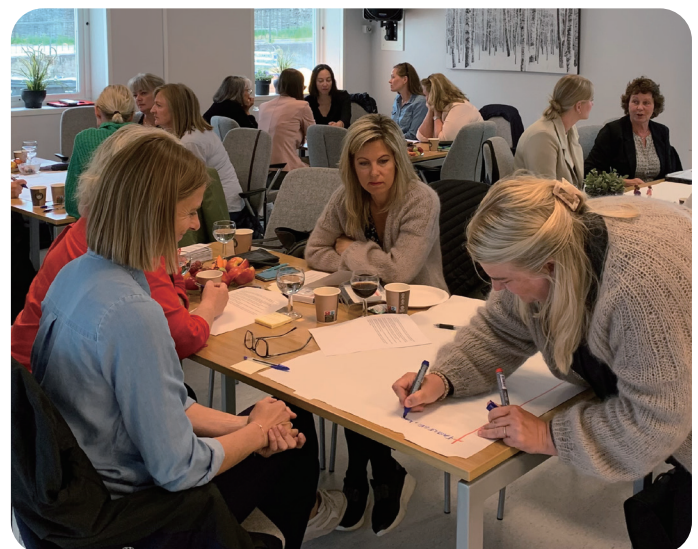
Workshop gode demensforløp

Arbeidet gjøres i tett samarbeid med Senteret for et Aldersvennlig Norge som driver det nasjonale nettverket for Aldersvennlig lokalsamfunn. Det regionale nettverket følger opp temaene fra det nasjonale nettverket og trekker det ned i et regionalt perspektiv med en mer arbeidsfokuset tilnærming. I 2022 er det gjennomført fire digitale samlinger hvor man har tatt for seg tema tverrsektorielt samarbeid, transport, innbyggerinvolvering og frivillighet. Fylkeskommunen, ulike aktører og kommunene selv har bidratt inn i planleggingen og med innhold. Det er også gjennomført en fysisk heldagssamling som ble lagt opp til et samskappingsverksted med tema fremtidens bolig, hvor også næringsliv og Husbanken bidro i planleggingen og deltakelse.