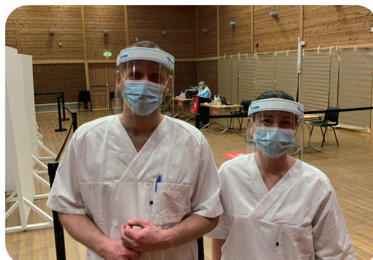
Covid testsenter Vågsbygd - USHT bistår i organisering og drift