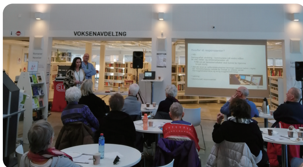
Arrangement om digital kompetanse for innbyggere.