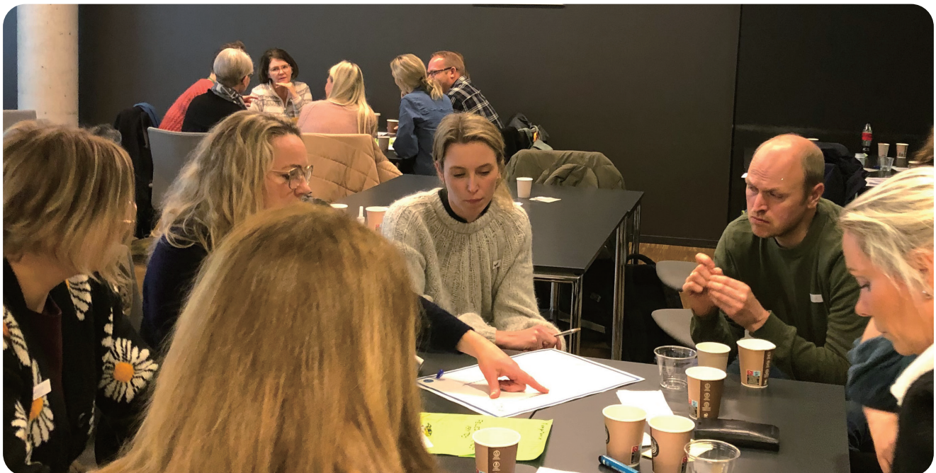
Workshop region Kristiansand "Samarbeid om skrøpeligheit".