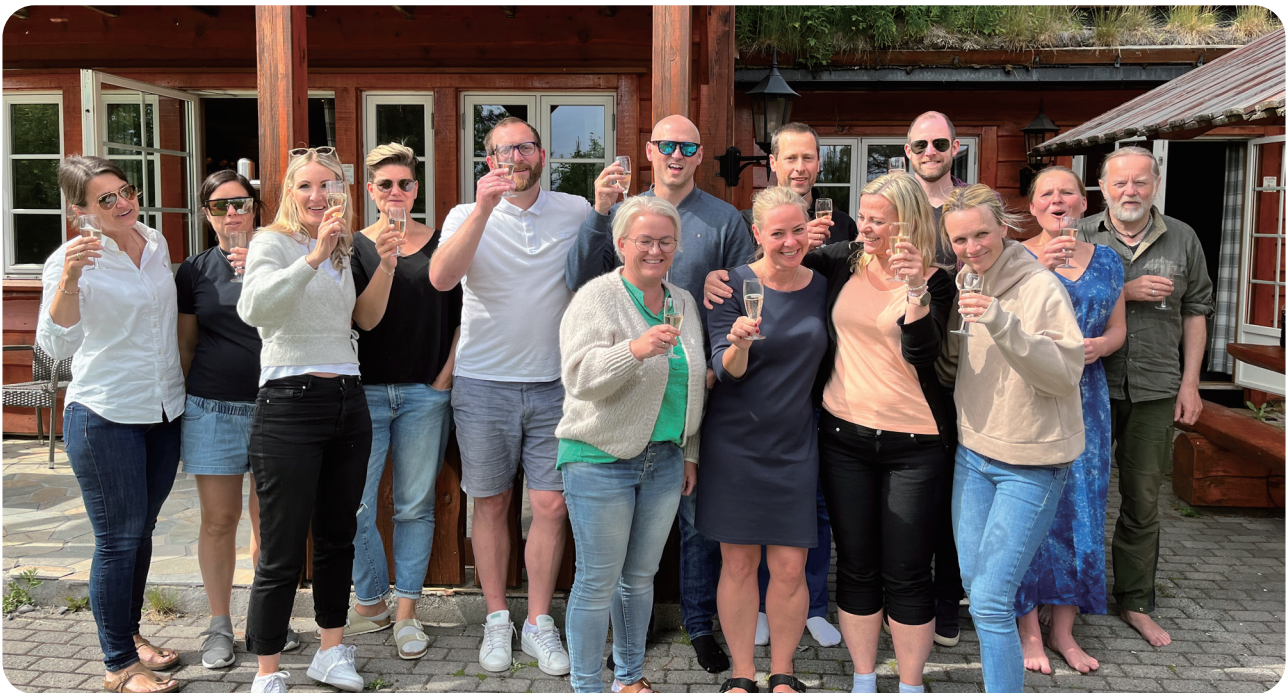
USHT Agder (vest)

USHT Agder har på lik linje med andre aktører i regionalt støtteapparat, tilbudt bistand til plan- og prosessarbeid til kommunene. USHT Agder vest har bidratt i planleggingen og gjennomføring av de regionale dialogmøtene med kommunene i 2022.