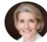
Amy Edmondson Harvard Business School Professor

Psychological safety is a belief that one will not be punished or humiliated for speaking up with ideas, questions, concerns or mistakes.”