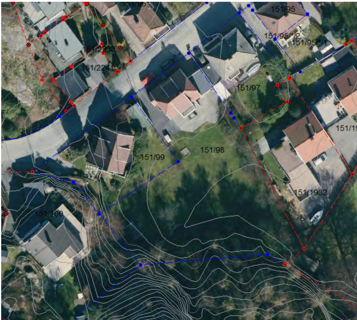
Dagens situasjon med eiendomsgrenser og høydekoter

Sent i prosessen kom det inn en merknad om å fradele eiendommen Bellevue 6A, gnr. 151. bnr 98. Reguleringsplanen høres i to alternativer.