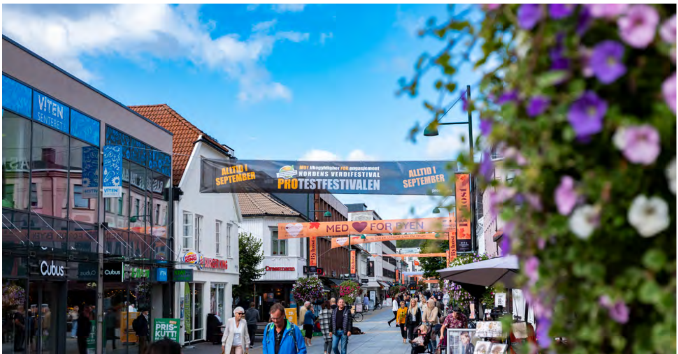
Det ikke tillatt med banner over gate for å markedsføre kampanjer eller arrangementer

Opphenging av bannere på lyktestolpene i Markens gate og Skippergata, avklares i hvert enkelt tilfelle med Innbyggertorget. Kulturelle arrangementer prioriteres på disse stolpene. Størrelsen på bannerne må være 39x195 cm.