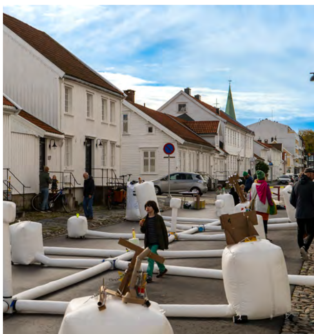
Øverste bilde fra "la Rampa" i Gyldenløvesgate. Nederste bilde fra "Barnas Arkitekturdag."