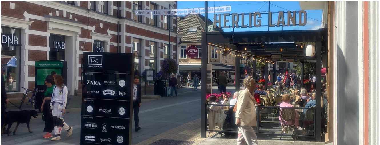
Uteservering i Markens

rømningsveier, brannsikkerhet etc. for den aktuelle virksomheten. Rømningsveier fra bygget må ikke blokkeres/redueres som et resultat av utplassering av møbler eller annet. Tilgang til infrastruktur under bakken, kummer etc. skal ikke hindres.