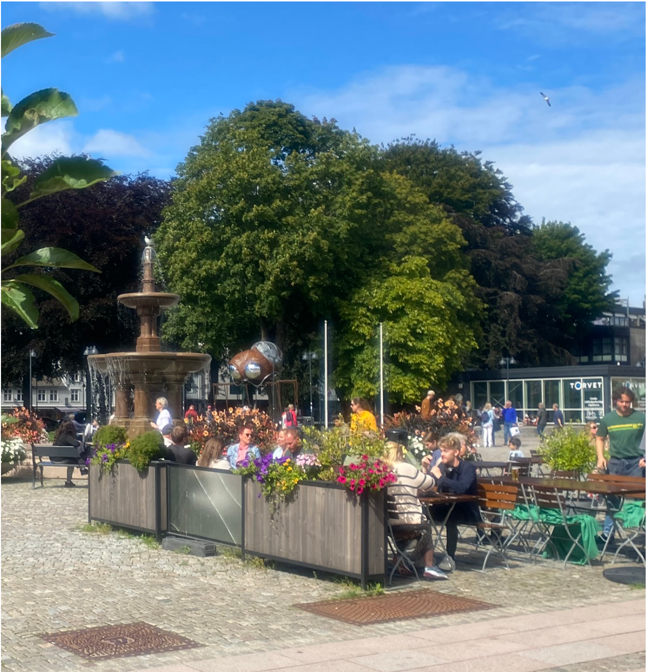
Område for uteservering på Øvre Torv