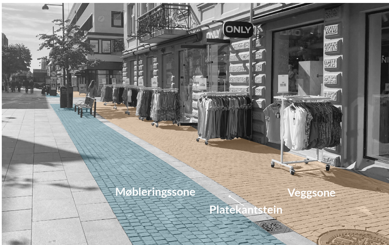
Soneinndeling i Markens