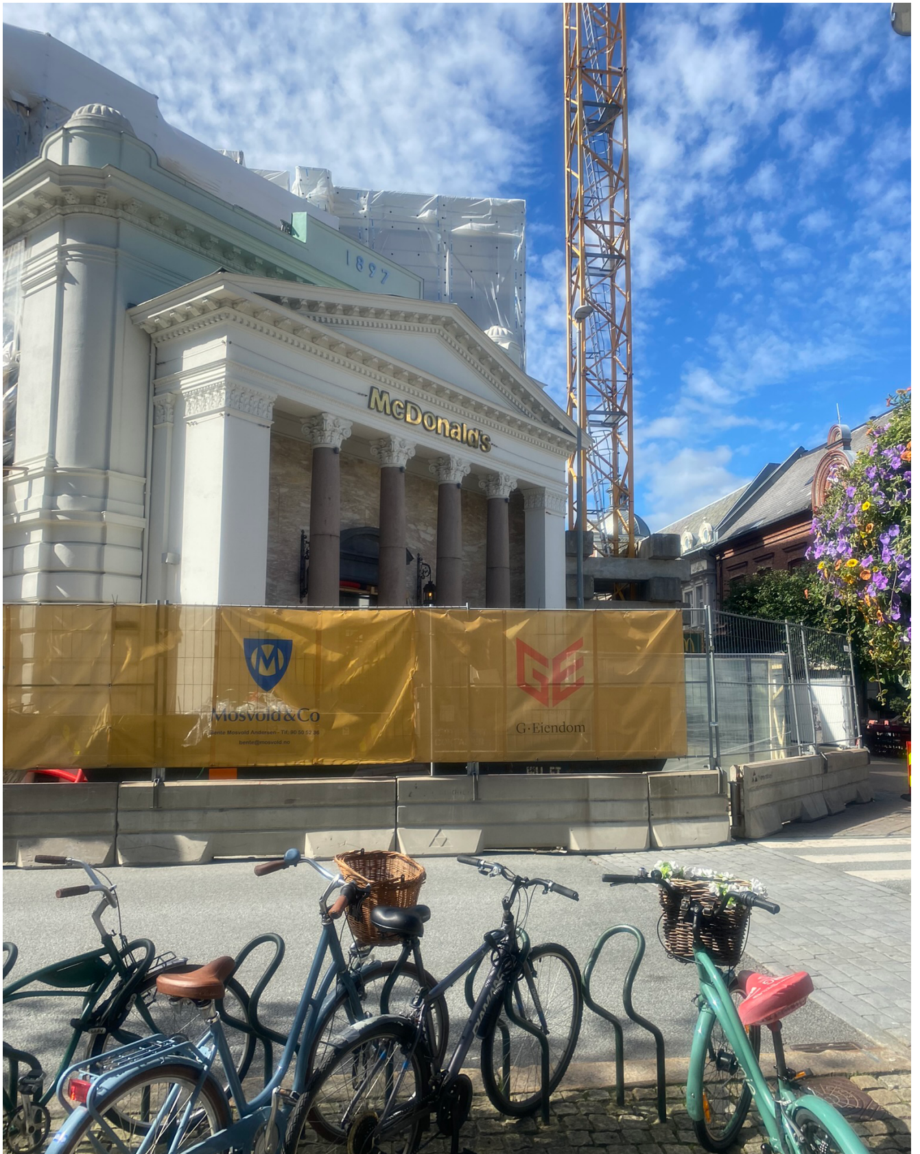
Anleggsområde i Markens