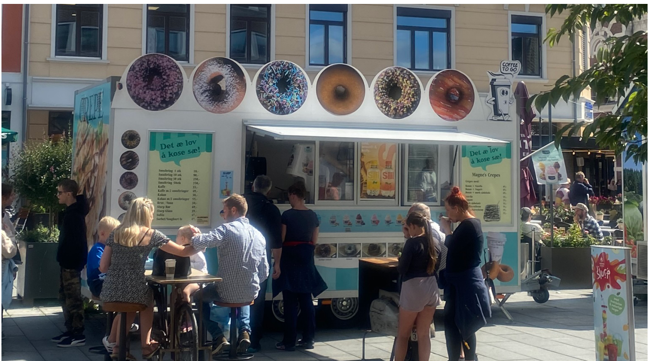
Salg fra mobil salgsvogn på Nedre Torv

Enhetene skal være mobile og skal ikke være større enn 2x3 meter (draget og hengerfestet er ikke medregnet i denne størrelsen), og ikke overstige 3 meters høyde (inklusive takoverbygg/reklame). Utsalgstedene kan være åpne alle dager, men må stenge innen kl. 20.00 hver dag.