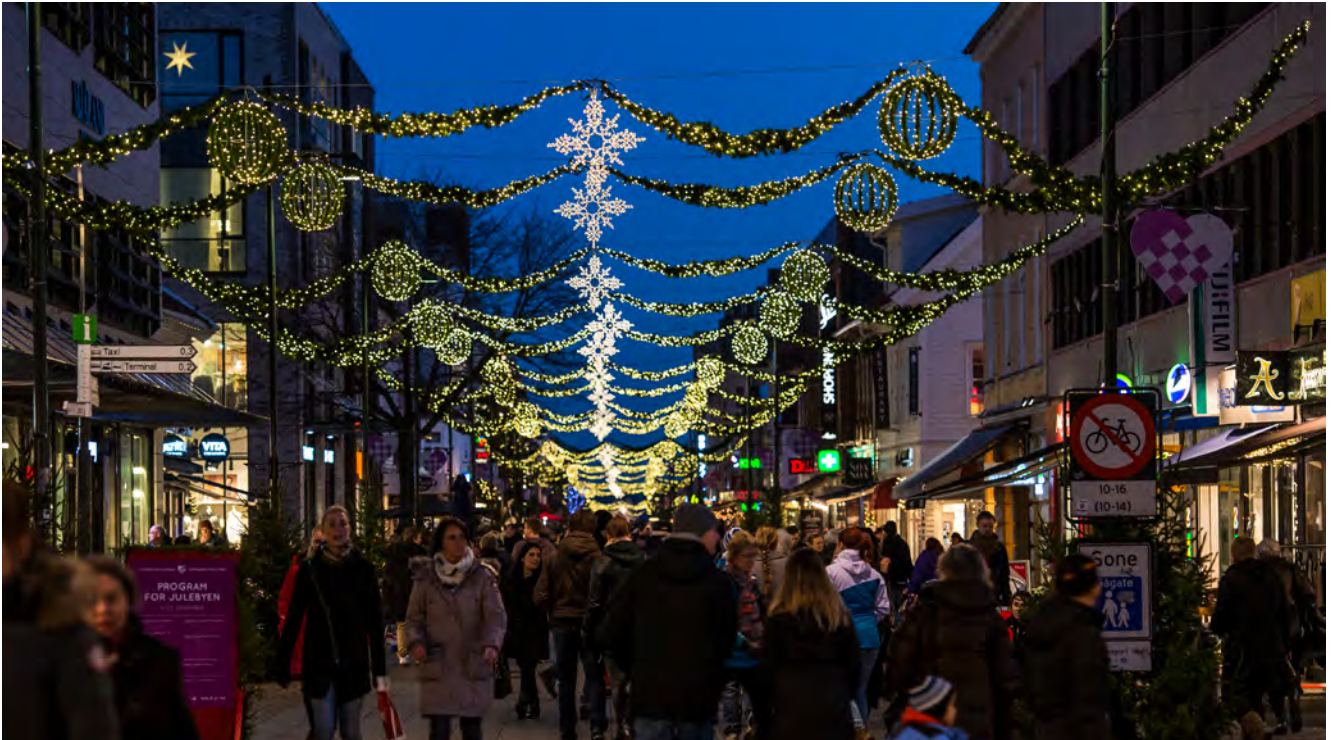
Julepynt i Markens