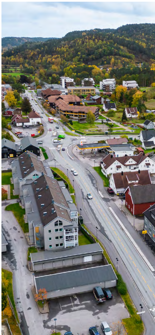
Nodeland sentrum med Haugenparken i bakgrunnen

Informasjon finner du her: Leie av kommunal grunn