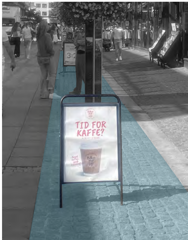
Møbleringssone i Markens

Salgsstativer og løsfotreklame skal tas inn når butikken er stengt.