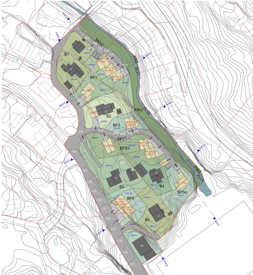
Foreløpig skisse til utbygging

Planen legger til rette for å etablere 11 nye boenheter i form av eneboliger og rekkehus. Ny bebyggelse planlegges på delvis ubebyggede og delvis bebyggede tomter, og innebærer en fortetting av området. Det er planens intensjon at fortettingen skal skje med kvalitet og på en måte som ivaretar eksisterende arkitektur og kvaliteter i planområdet. Antall boenheter er foreløpig, og kan bli justert underveis som resultat av planprosessen.