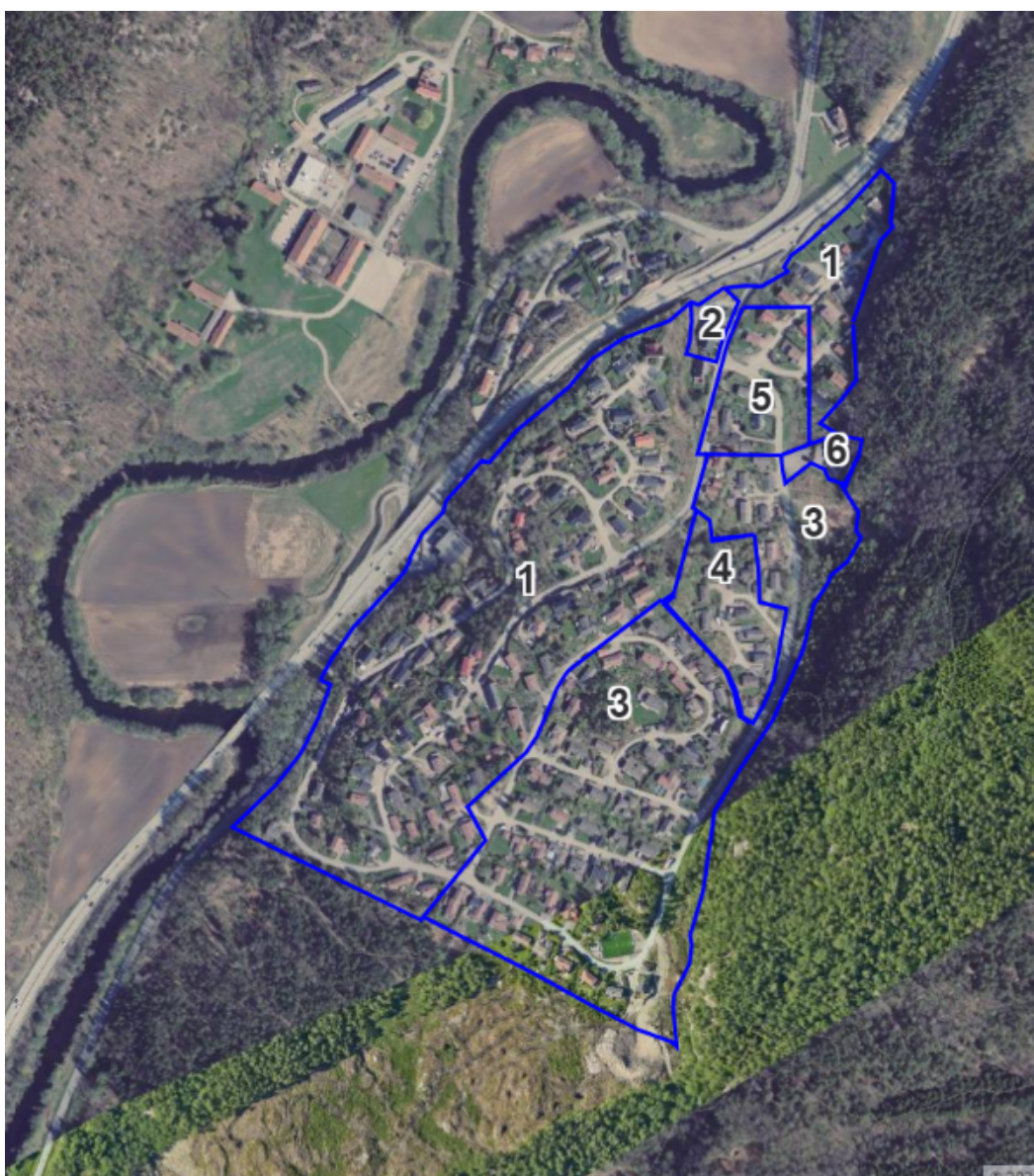
Planområdet. Delområdene med tall viser plangrenser av reguleringsplaner som blir erstattet av den nye detaljreguleringen.

Dette brevet sendes til alle grunneiere, berørte naboer og offentlige myndigheter for at de skal få anledning til å komme med sine kommentarer. Det er nå du som berørt part har mulighet til å påvirke hvordan planen blir til slutt. Derfor er det viktig at du setter deg inn i planforslaget på kommunens hjemmeside, og kommer med dine kommentarer i løpet av høringen. Høringsperioden er fra 08.10 – 18.11. Høringsuttalelsen din blir vurdert og kommentert i sakspapirene til areal- og miljøutvalget og bystyret og besvares ikke skriftlig. Etter at bystyret eventuelt har vedtatt detaljreguleringen, sendes melding om vedtaket til deg og de andre berørte partene. I samme brev får du også informasjon om hvilke muligheter du har til å klage på vedtaket.