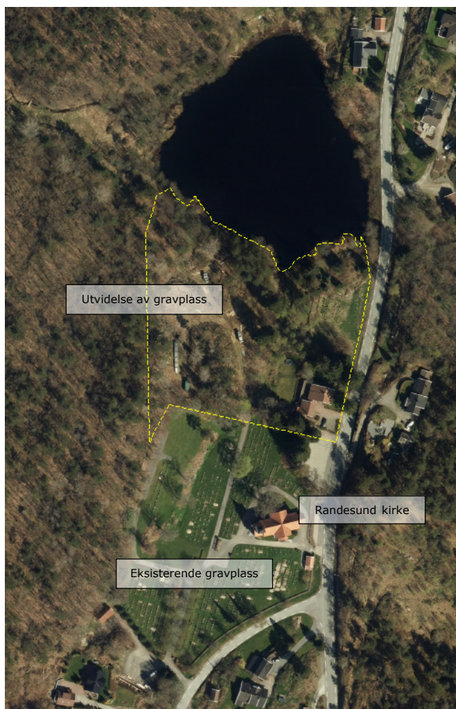
Figur 1 - Planavgrensning vist med gul strek

Planområdet ligger nord for eksisterende gravplass og Randesund kirke. Området avgrenses i nord av Frikstadtjønnen, i øst av Kongshavnveien (fylkesvei), i sør av eksisterende gravplass og mot vest av en bratt fjellskrent. Omkringliggende arealer er uberørt skog, jordbruk og noen boliger.