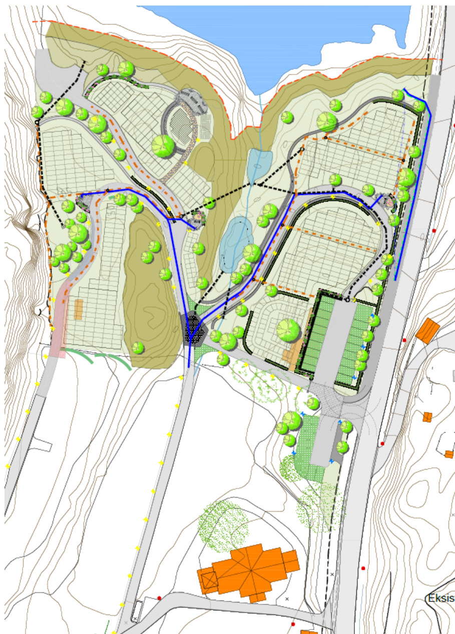
Figur 3 - Illustrasjonsplan