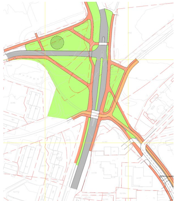
Ingeniørvesenets utkast til ny løsning