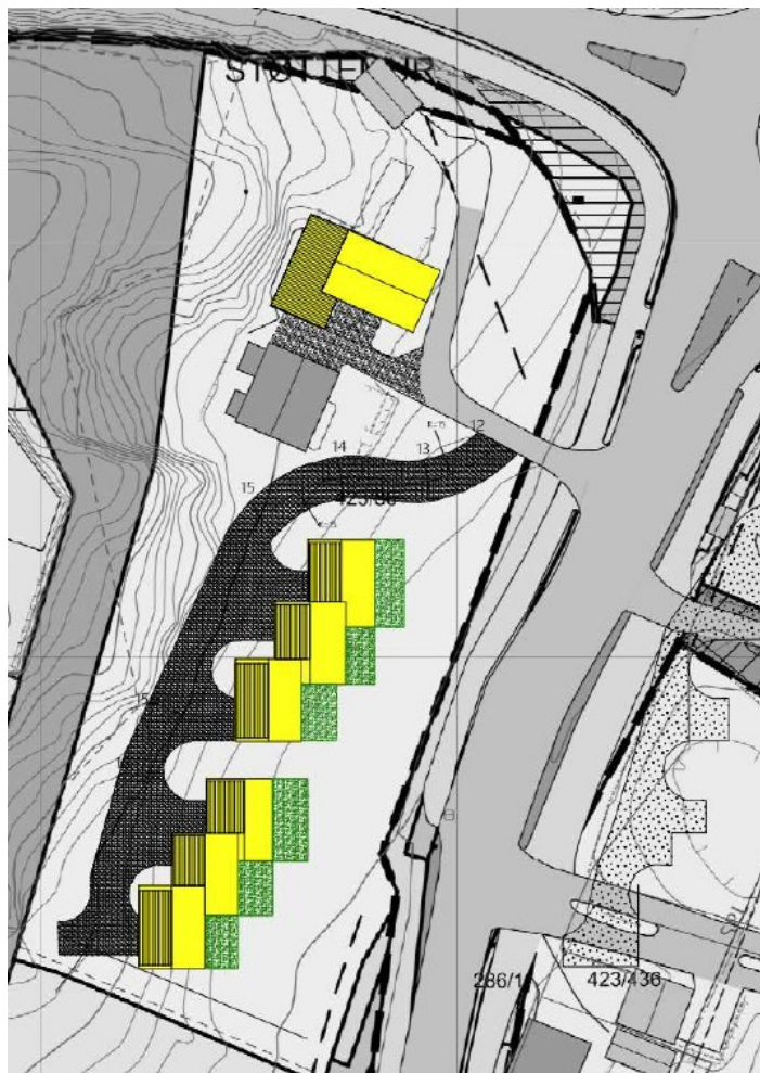
Illustrasjoner over og under fra planinitiativ datert 08.11.22

Forslagsstiller ønsker å innpasse 8 nye boenheter på eiendommen i tillegg til eksisterende i våningshuset (2 der låven er og 6 i sør).