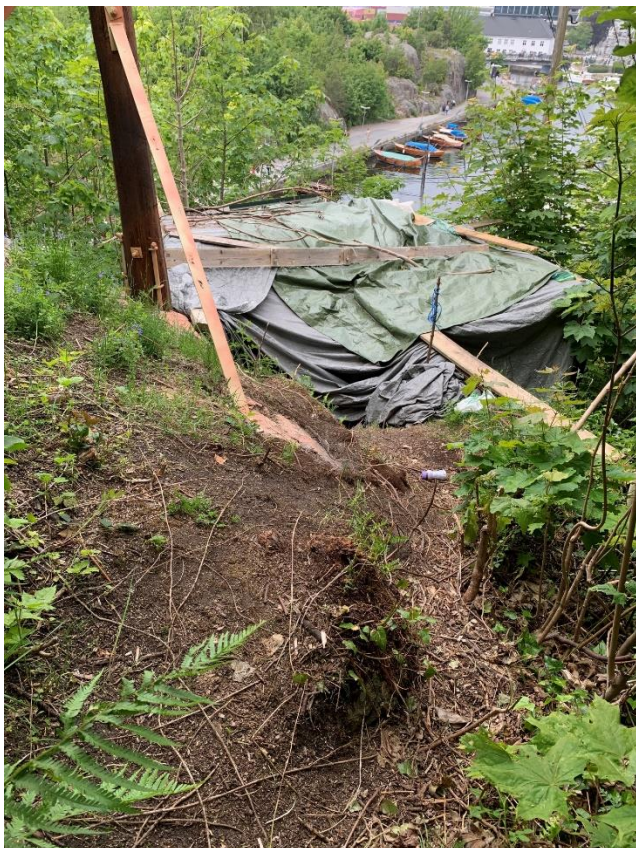
Camping på Odderøya, juni 2023

Atferdsreglene er vedtatt som lokal forskrift etter friluftslovens §15. Endring i forskriften må høres og vedtas av formannskapet før de kan tre i kraft.