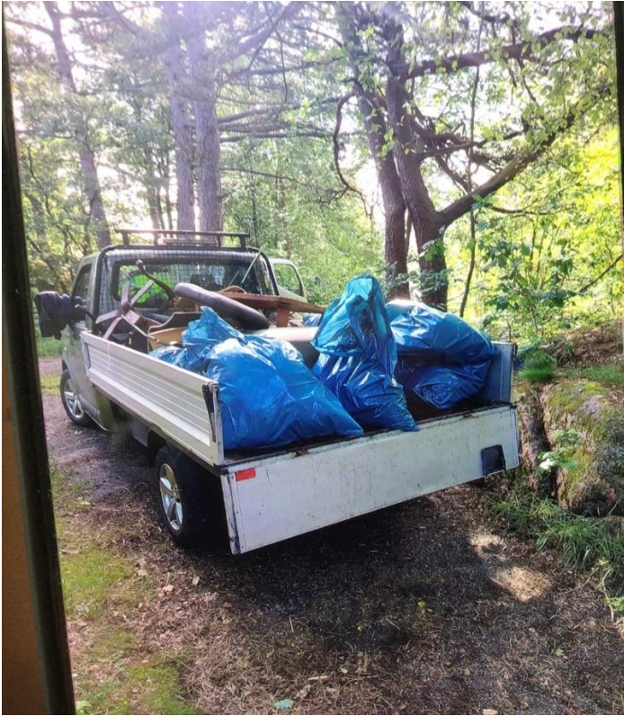
Opprydding etter camping i Baneheia, juli 2023