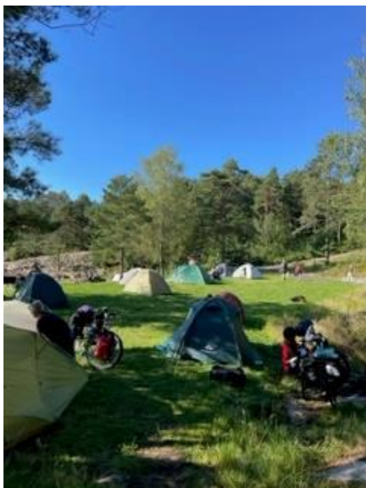
Fotos fra Paradisbukta ved Fagerholt fredag formiddag 04.08.2023.

Camping på disse områdene medfører også en overbelastning på områdenes toalettkapasitet og renovasjonsfasiliteter. Ikke alle områder har toalett fasiliteter som gir konsekvenser i busker og kratt.