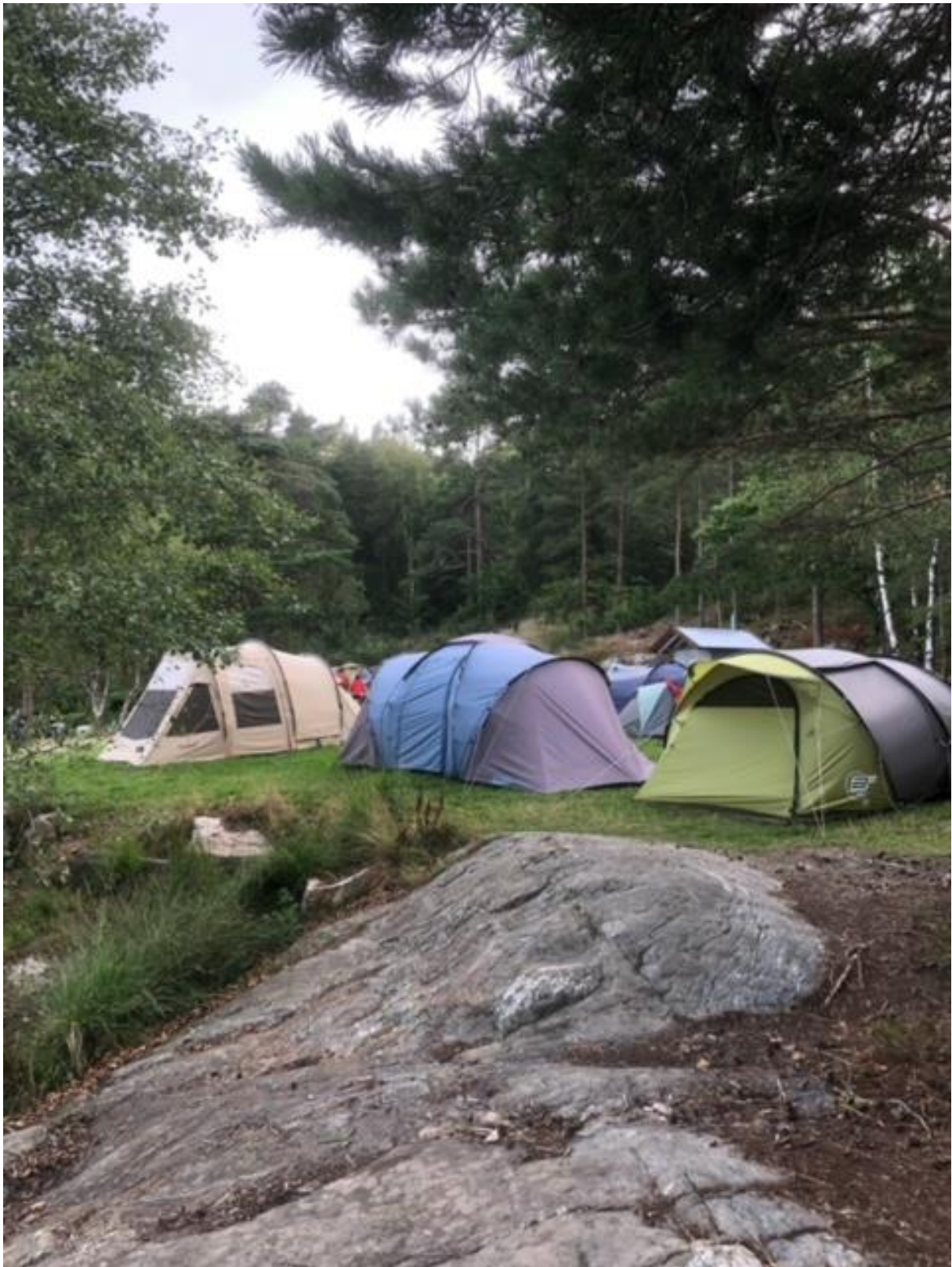
Paradisbukta ved Fagerholt, august 2023

Ordningen med at telt og utstyr skal tas bort i skoleferien i tidsrommet 09.00 – 20.00 respekteres ikke. Parkvesenets driftsavdeling påpeker reglene overfor camperne. Noen steder blir dette imøtekommet og camperne lover å fjerne telt, men ikke alltid. Teltene kommer ofte raskt opp igjen etter at driftsavdelingen har forlatt stedet.