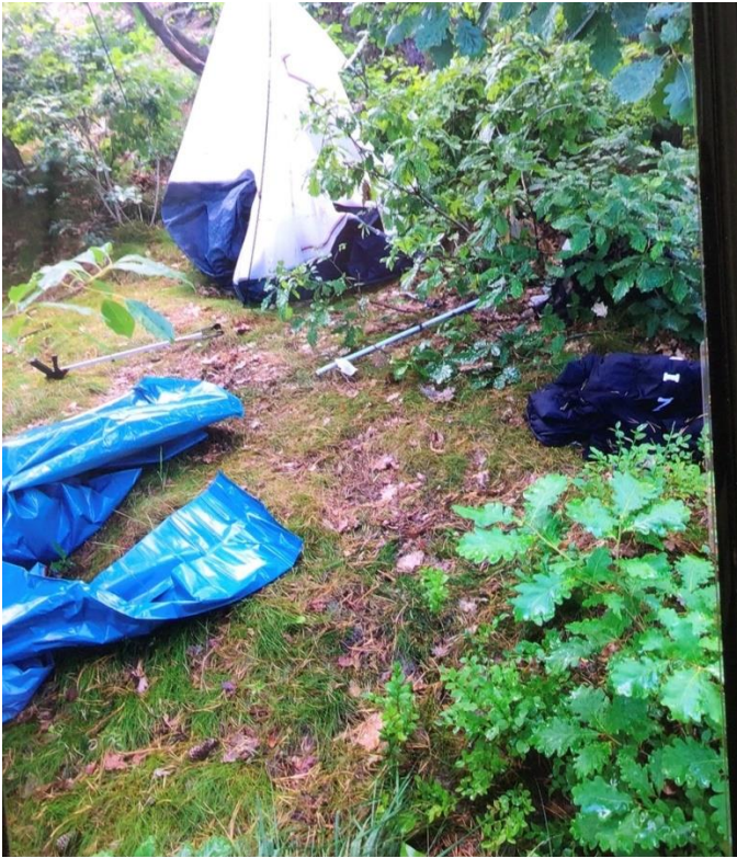
Rester etter camping i Baneheia, juli 2023

For å få forutsigbare regler som er mulig å overholde må det vurderes om begrensningen i døgnet må fjernes og camping bare være tillatt på de områdene som tåler denne bruken, dvs. ikke på bolig nære og mye brukte friområder.