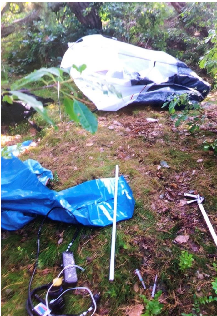
Rester etter camping i Baneheia, juli 2023