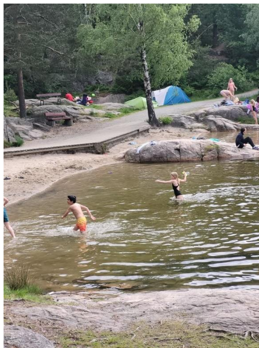
Telting i Baneheia, juni 2021